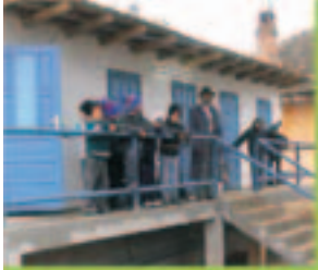
Մեզի եւ կղանքի բաժանմամբ սահմանգույցի շէնք Ռումինիայում